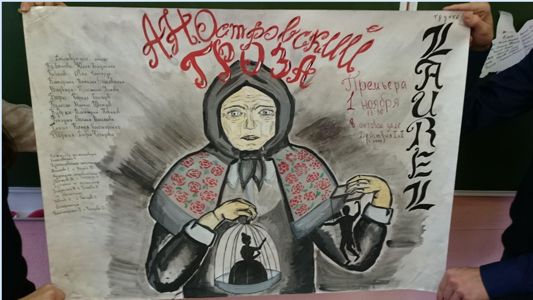
Кабаниха «люта», «крута» в соблюдении «старины» - и всё «под видом благочестия»