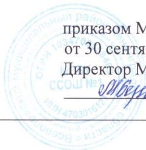
График организации питания обучающихся на 2024 – 2025 учебный год